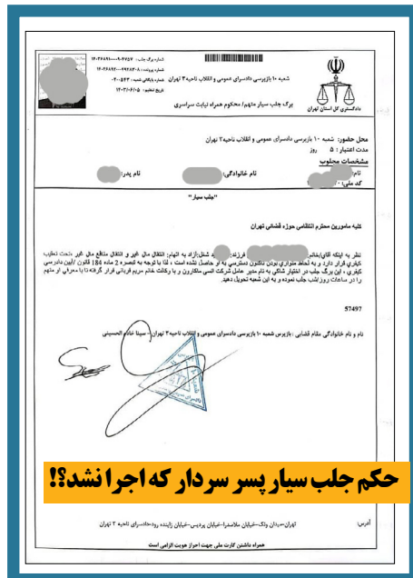
حکم جلب سیار پسر سردار که اجرا نشد!؟