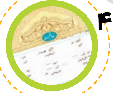
سند تک برگ زمین صادر شد