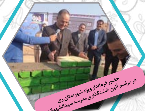
حضور فرماندار ویژه شهرستان ری در مراسم آئین خشتگذاری مدرسه سیدالشهدا (ع)

هیات منتخب در اجرای اهداف پروژه با رضایت اعضا اقدام به ساخت خیرخواهانه دیوار مدرسه (ضلع شمالی) خیرساز کرد. آئین خشتگذاری مدرسه سیدالشهدا (ع) کهریزک با حضور فرماندار شهرستان ری، بخشدار و شهردار کهریزک، امام جمعه بخش کهریزک و جمعی از مدیران شهرستان در آذرماه ۱۴۰۱ برگزار شد. حمید زمانی فرماندار شهرستان ری در این مراسم با تقدیر از اقدام خیرخواهانه هیات منتخب گفت: این مدرسه بنا است در بهترین نقطه، مرغوب ترین زمین و با کیفیت ساخت و زیر بنا احداث شود و باید با سرعت و بدون وقفه عملیات عمرانی آن پیش برود.