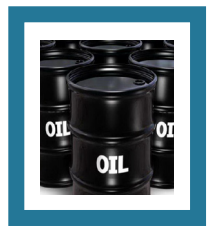
دبیرکل کانون همبستگی فرهنگیان ایران

هفتم تیر، شهادت تعداد کثیری از یاران انقلاب اسلامی است که بیشتر نام شهید دکتر محمدحسین بهشتی که وجود و اندیشه اش بزرگ بود بر سر زبانهاست. به ایشان و یارانش درود می فرستیم. از مظلومیت اشان خاطرات زیادی دارم و یادم هست وقتی برای یک سخنرانی دعوت شده بودند به این مضموم فرمودند: «نگذاشتند ما نفت را از ید دولت خارج کنیم و در اختیار ملت قرار دهیم و برای ما پس از ۳۷ روز از پیروزی انقلاب اسلامی فتنه ها را ایجاد کردند» این یادداشت را به روح آن شهید و یارانش تقدیم می کنم تا شاید مجلس شورای اسلامی با مصوبه ای نفت را از دولت خارج کرده و ملی کند. در دنیای امروز بعضی دولت ها نفت