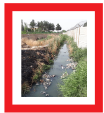
گزارشی از انتهای شهر

در انتهای باقرشهر که به دیوار سیمانی برخورد می کنیم هم خانواده های زیادی زندگی می کنند. آنها هم مانند بخش جدید و لوکس شهر حق دارند از خدمات شهرداری استفاده کنند اما سهم آنها بوی نامطبوع کانال فاضلاب و گرد و خاک ناشی از زمین خاکی و برخورد با معاندان متجاهر است. اهالی می گویند: یک قطعه زمین که گفته می شود متعلق به اوقاف است سالهای سال متروکه و خاکی رها شده و هر بار که باد می آید تمام خانه ها و فروشگاه ها را آلوده می کند. آنها بارها و بارها به مسئولان شهرستان ری و شهرداری باقرشهر گلیا و شکایت کردند اما هیچ اقدامی انجام نشده است. وقتی فهمیدند خبرنگار