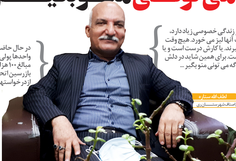
لطف الله ستاره