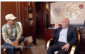
رئیس اتاق اصناف شهرستان ری

جالب است بدانید که تا الان ۱۶۰۵۷ واحد صنفی بدون پروانه فعالیت شناسایی کردیم. شامل همین تالارها و کبابی ها و حدود ۲۰۰ قهوه خانه غیر مجاز و ... است که تماما واحدها را شناسایی کردیم و جداگانه به تمام ۴۴ اتحادیه ابلاغ شد که پیگیر مجوز واحدها باشند و نتیجه را ابلاغ کنند. در تمام محلات و مناطق دور و نزدیک شهرستان ری انواع و تعداد اصناف و واحدهای مجاز و غیر مجاز را مشخص کردیم. این کار اتاق اصناف حرفه ای و بسیار پراهمیت بود و بدنبال آن کار اتحادیه ها هم سه برابر شده است. اتاق اصناف سابق از اتحادیه ها ۳٪ بابت حق دفاتر دریافت می کرد در حالی که هیچ دفاتری وجود نداشت در حالی که ما بدون دریافت این ۳٪ این دفاتر را ایجاد و ثبت کردیم.