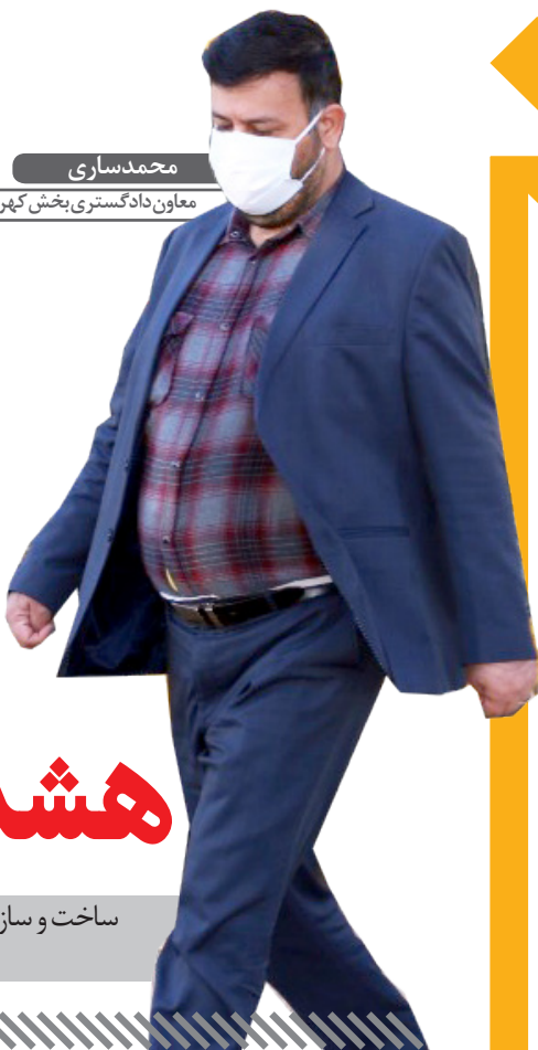
محمد ساری معاون دادگستری بخش کهریزک